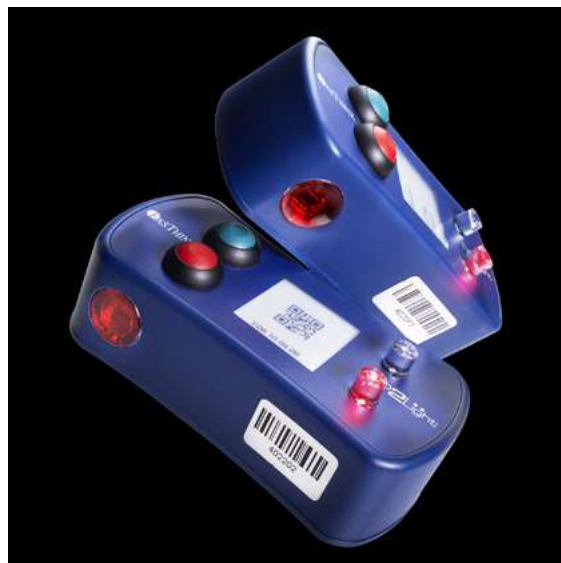
Tecnologia OT "Pick2Light"

Non si riesce a prescindere da questo aspetto, sul quale le aziende e i system integrator ci chiedono incessante affiancamento, affinché le tecnologie possano integrarsi e armonizzare con i sistemi informatici quali ad esempio ERP, WMS, MES, di cui l'azienda si è dotata.